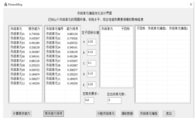
图 2 作战单元调度优化编组界面

笔者使用 Visual studio 2012 软件，基于对话框的 MFC 应用程序界面设计对算例进行仿真计算。根据已知条件，可以计算作战能力并进行排序，程序设计界面如图 2 所示。