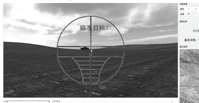
图6 瞄准线控制仿真结果

利用Xilinx公司仿真软件ISIM进行仿真，结果如图4所示。图5为计算机网络调试助手，可以看到，每隔100ms，不断地有网络数据包发送上来，这些都是旋编信息。