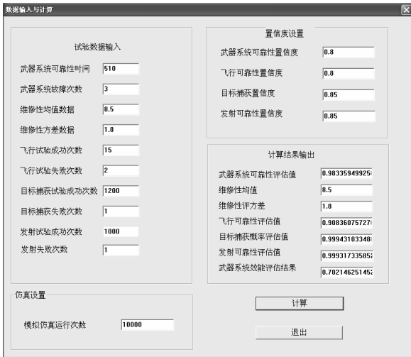
图 4 舰空导弹武器系统效能评估程序主界面

舰空导弹武器系统效能评估程序主界面见图 4。运行时先输入试验数据，确定仿真置信度和仿真运行次数，仿真程序首先根据试验数据计算武器系统关键性能指标，然后调用随机模拟模块计算武器系统效能，给出效能评估结果。