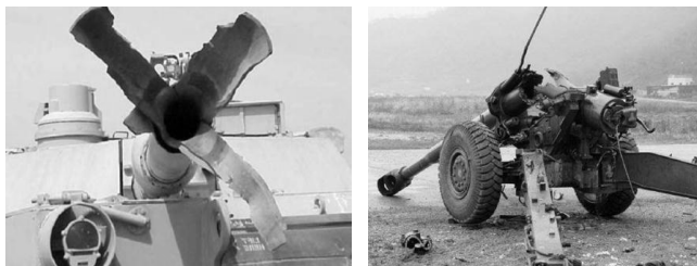
(a) 美国某型坦克炮身管炸裂 (b) 韩国 155 mm 榴弹炮爆炸事故

身管寿命终止有很多表现形式, 例如弹丸在弹道上失去稳定、弹带削光、射击精度变差、初速下降至规定量值、初速或然误差增大、射弹密集度下降到规定值、弹丸早炸、连续瞎火、炸膛(图 1)以及不能完成作战目的等 [9-10] 。